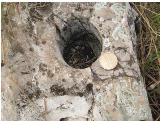
Karr (Székelykő, Erdély)