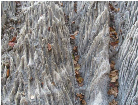
Sókarr (Szováta, Erdély)

Magyarország legjelentősebb karsztos formakincseit az Aggteleki-karsztban és a Bükkben találjuk.