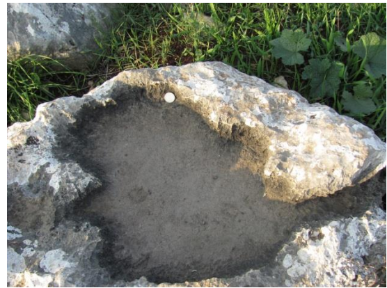
Karr (Madáritató túlfolyási vályúval, Izrael)